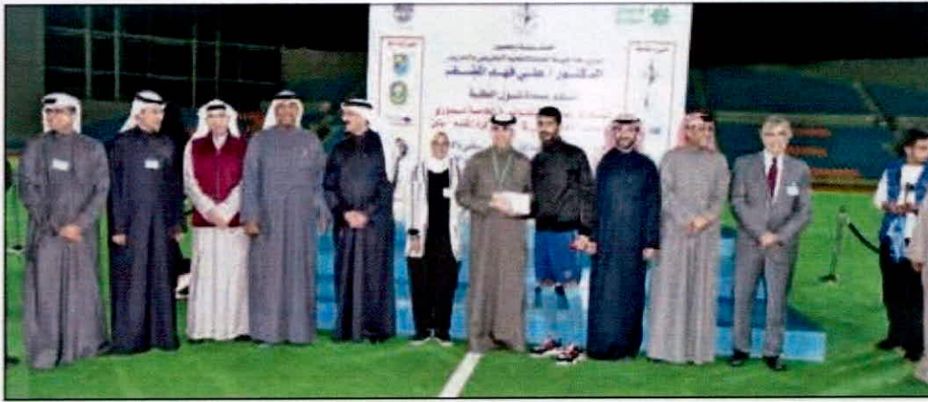
• مسؤولو التجاري خلال تتويج الفريق الفاز