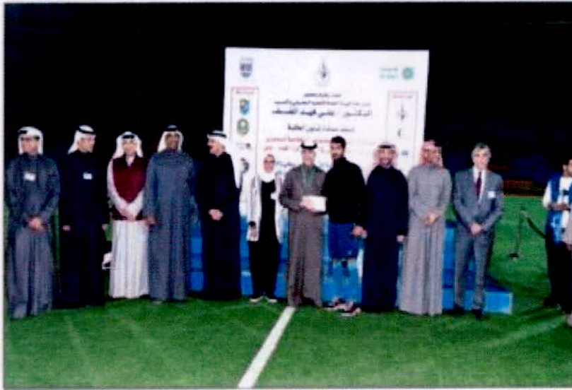
تكريم الفرق الفائزة بحضور سكرتي البنك والهيئة العامة للتعليم التطبيقي والتدريب.

في إطار حرص البنك التجاري الكويتي على رعاية الأنشطة الطلابية ضمن برامج المسؤولية الاجتماعية للشراكة المجتمعية، قام البنك برعاية بطولة دوري مؤسسات التعليم العالي الخامسة لكرة القدم للعام الدراسي 2018/ 2019 والتي انطلقت من قبل عمادة شؤون الطلبة في الهيئة العامة للتعليم التطبيقي والتدريب والتي حظيت بمشاركة فرق من الجامعات المتواجدة في الكويت، بالإضافة إلى الفرق الرياضية لكافة صناع السلام العسكرية وقبة سعد العبدالله للعلوم الأمنية والإدارة العامة للإطفاء.