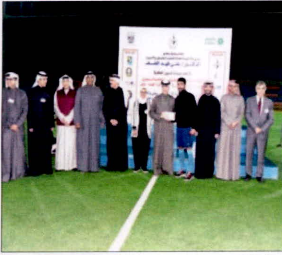
توزيع فريق لقاتز

من 15 وحتى 21 سنة، ويقدم العديد من المزايا المصرفية الحصرية، ومنها الخصومات المميزة لدى العديد من المحلات و المطاعم، بالإضافة الى خصم 50 في المئة طوال الاسبوع في «سينما فوكس» في «الفيوز» وهدية نقدية بقيمة 50 ديناراً عند تحويل المنحة الاجتماعية، بالإضافة للنشاطات والفعاليات المميزة التي ينظمها البنك كل عام لأصحاب «Tijari» من جانبهم، عبر مسؤولو الهيئة العامة للتعليم التطبيقي عن شكرهم لـ «التجاري» على رعاية البطولة والتي تضاف إلى سجل البنك المضيء في مجال المسؤولية الاجتماعية، وجهوده المستمرة لتحقيق التنمية الاجتماعية المستدامة.