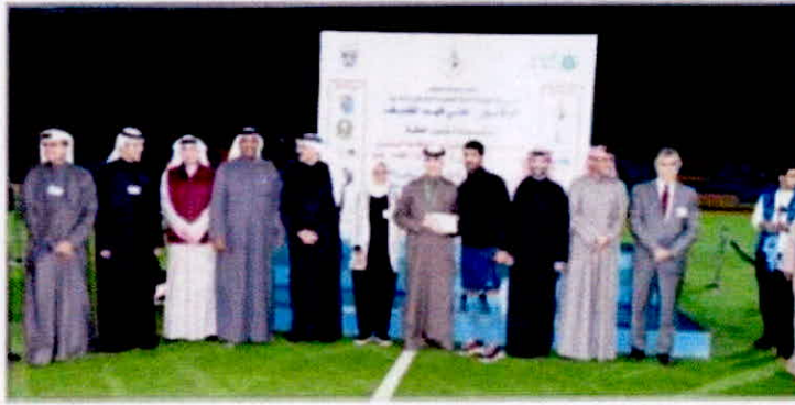
البنك رعى بطولة دوري المؤسسات

عليها ليؤكد اهتمامه بالتواجد الدائم والدعم من جهة وكذلك لتوطيد العلاقات المتميزة القائمة بين البنك وجهات التعليم العالي من جهة أخرى، فضلا عن إيمان البنك بدور الرياضة في خلق جيل رياضي مخلص وموكلب لكل ما هو جديد وحديث. ومن المعروف أن البنك التجاري يضع الشباب الكويتي في بؤرة اهتمامه بالبنكر المنتجبات المصرفية التي تناسب الشباب الكويتي ومنها حساب Tijari@ للشباب والذي يعد حساب توفير مخصص للملاء من الفئة العمرية من 15 إلى 21 سنة، يقدم العديد من المزايا المصرفية الحصرية الخصومات ومنها الخصومات المميزة لدى العديد من المطاعم والمطاعم بالإضافة إلى خصم 50٪ طوال الأسبوع في سينما فوكس في الأقبوز ومهدية نقدية بقيمة 50 دينار كويتي عند تحويل المنحة الاجتماعية بالإضافة للنشاطات والفعاليات المتميزة التي ينظمها البنك كل عام لأصحاب حساب Tijari@.